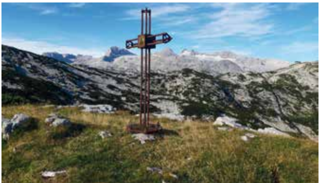
Gipfelkreuz mit Dachstein