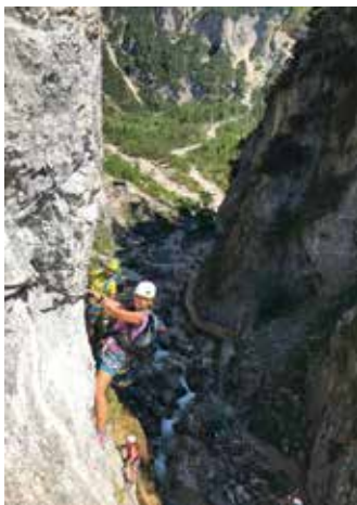
Am Hias Klettersteig