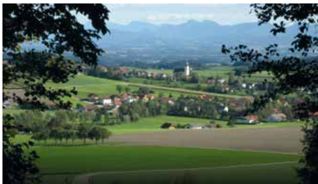
Blick über Ottnang