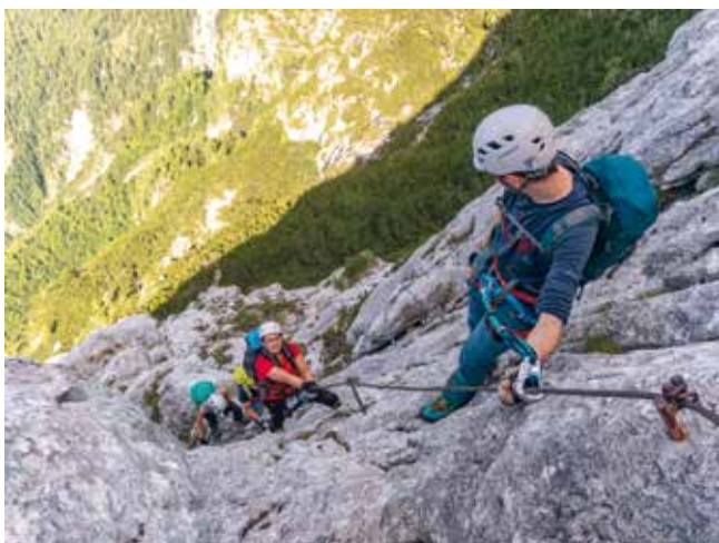
Klettersteig in Südtirol