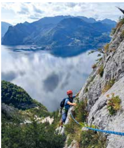
In der Route „Wer putzet der findet“