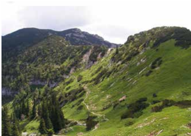
Aufstiegsgelände am Kasberg