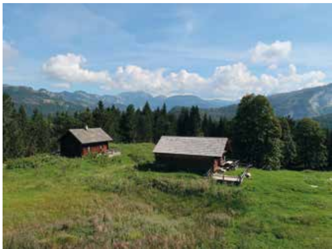
Blick in das Tote Gebirge