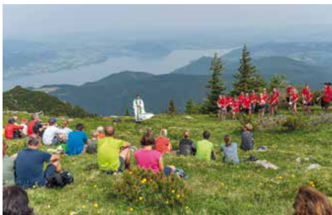
Bergmesse beim Hochleckenhaus