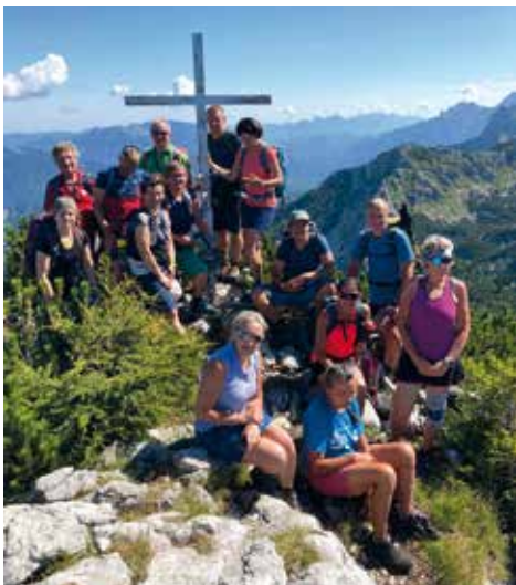
Am Gipfel des Plagitzers (Grünberg)