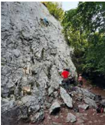
Seilschaft im Klettergarten