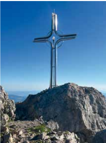
Hoher Göll Gipfelkreuz