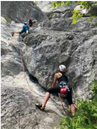
Klettern an der Ewigen Wand