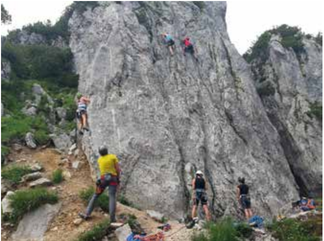
Gruppe im Klettergarten