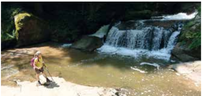
Katarakt im Pesenbachtal