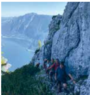
Über den Jagasteig zum Hirlatz