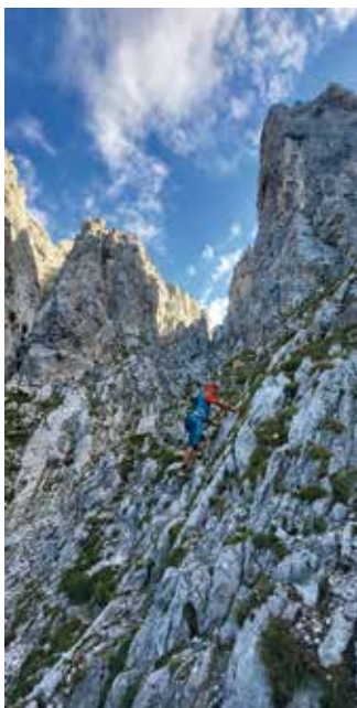
Am Weg zum Rossschweif