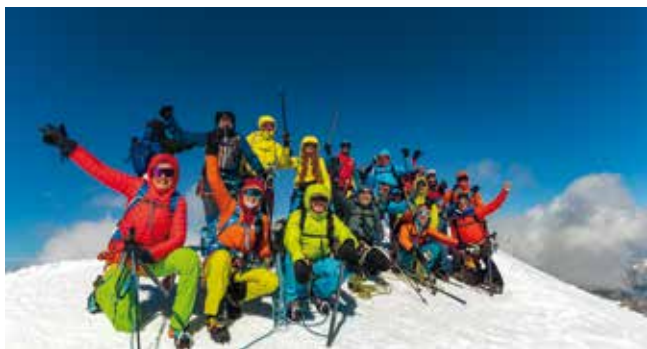
Am Gipfel des Castors (Schweiz)

Begrenzte Teilnehmerzahl. Anzahlung € 50,-.