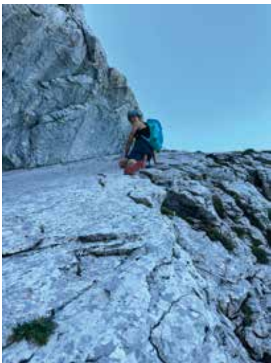
Kletterei am Welserweg