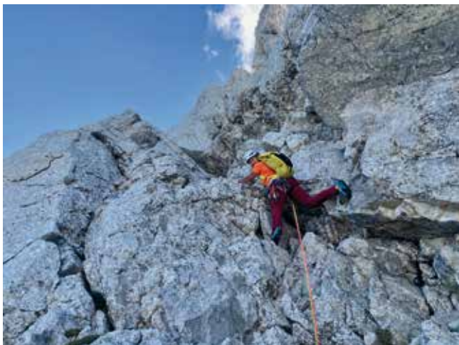
Klettern im Gosaukamm