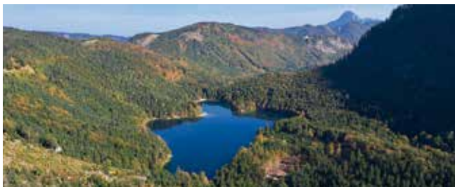
Blick zum Langbathsee

Anmeldung: per Telefon oder Mail bis spätestens am Mittwoch vor der Tour