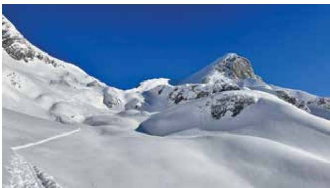
Aufstieg zum Scheiblingstein

Anmeldung: jeden Mittwoch von 19.00-21.00 Uhr im Vereinsheim oder per WhatsApp