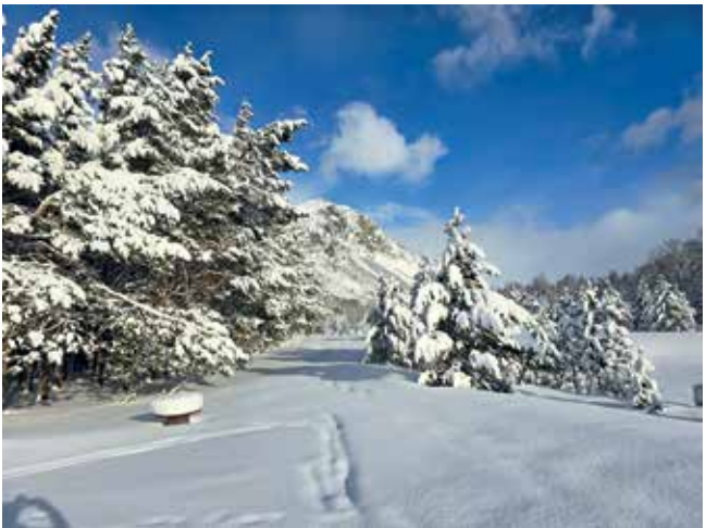
Winterlandschaft im Toten Gebirge