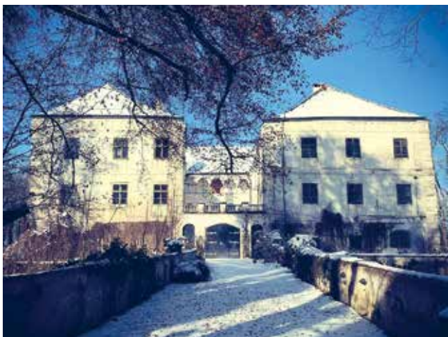
Winter in Schloss Katzenberg