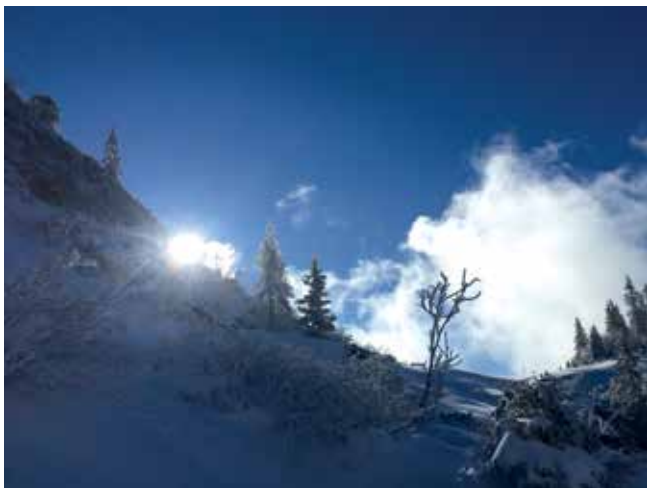
Aufstieg zum Hochkarfelderkopf

Anmeldung: jeden Mittwoch von 19.00-21.00 Uhr im Vereinsheim