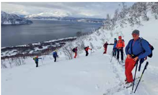
Norwegen - Lyngenalps