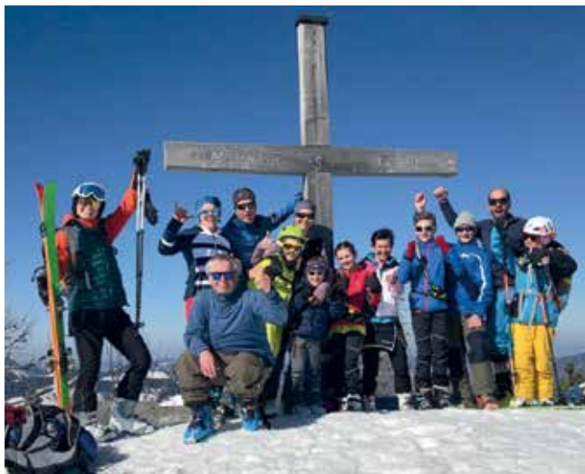
Am Gipfel des Pitschenbergs

Anmeldung: jeden Mittwoch von 19.00-21.00 Uhr im Vereinsheim