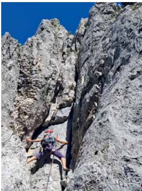
Im SW-Kamin am Adlerspitz