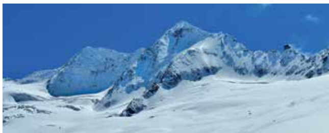
Großer Mösele und Waxenkees