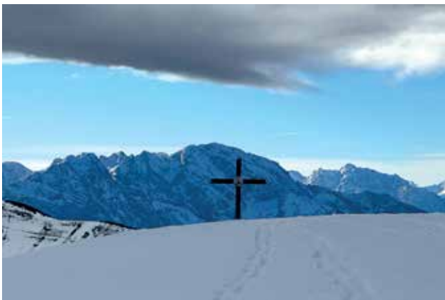
Gipfel Hohe Zinken

Anmeldung: jeden Mittwoch von 19.00-21.00 Uhr im Vereinsheim