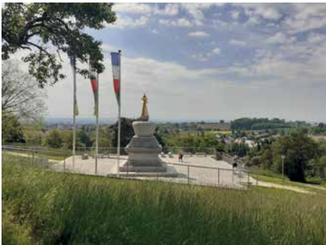
Stupa am Freinberg