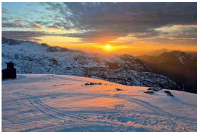
Sonnenuntergang am Krippenstein

Anmeldung: Bitte per WhatsApp oder im Vereinsheim.