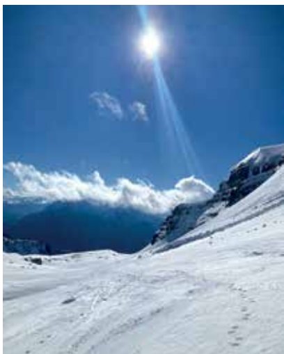
Aufstieg zum Großen Tragl

Anmeldung: jeden Mittwoch von 19.00-21.00 Uhr im Vereinsheim bis 4. März 2026