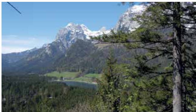
Hintersee und Reiteralpe vom Wartstein