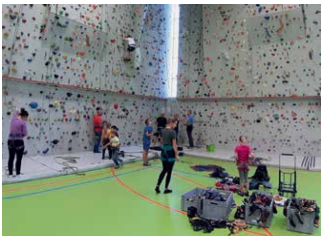
Familien beim Klettern