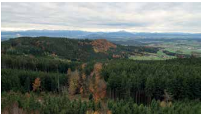
Spätherbst am Göblberg