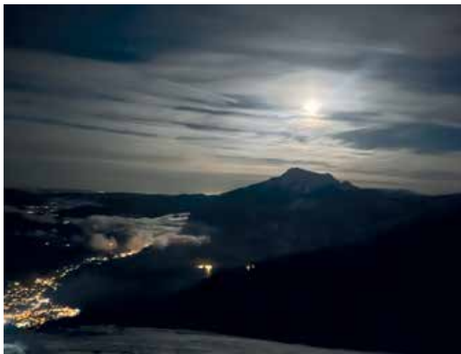
Blick vom Zwölferhorn bei Nacht

Anmeldung: bitte über E-Mail oder WhatsApp bis Mittwoch der Vorwoche