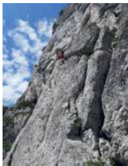
Klettern beim Vorstieg im Fels