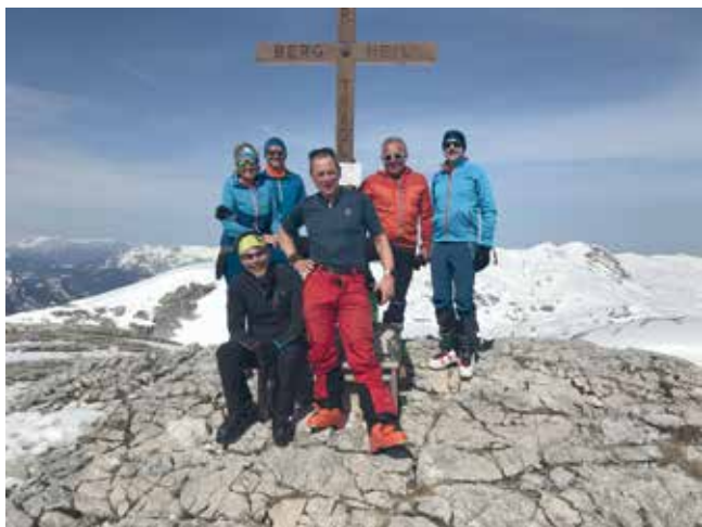
Am Gipfel des Großen Tragl

Anmeldung: WhatsApp Anmeldung oder jeden Mittwoch von 19.00 bis 21.00 Uhr im Vereinsheim Lenzing