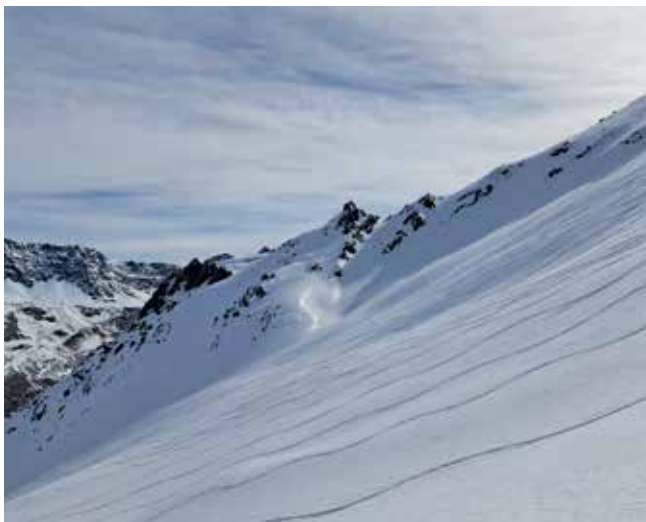
Schitour am Reschenpass

Anmeldung: jeden Mittwoch von 19.00-21.00 Uhr im Vereinsheim bzw. WhatsApp