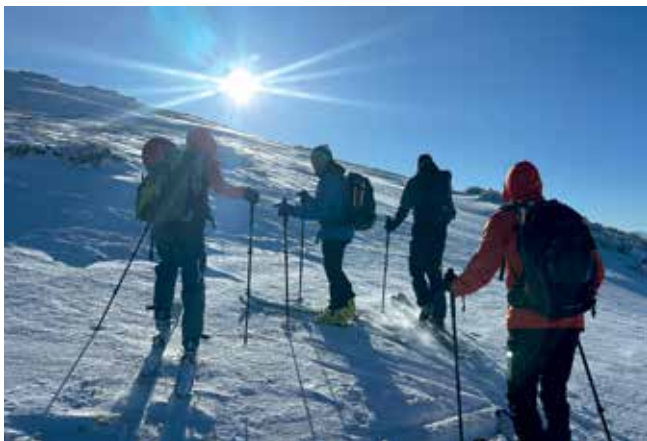
Aufstieg zum Gamsfeld

Anmeldung: jeden Mittwoch von 19.00-21.00 Uhr im Vereinsheim bzw. WhatsApp