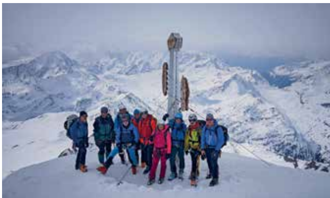
Schitour rund um die Brancahütte