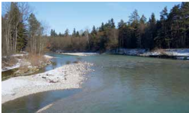
Winterliche Alm bei Bad Wimsbach

Leitung: Christian Meister, 0680/3060654, meister.c@cablevision.at