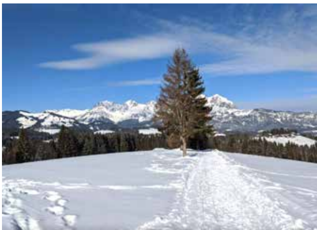
Wilder Kaiser vom Bichlachrundweg