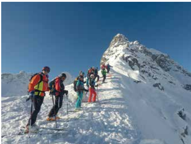
Abfahrt Variante Zürser Täli