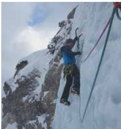
Im Steileis Kranjska Gora

Anmeldung: bis 7. Jänner 2026 per Tel. od. WhatsApp