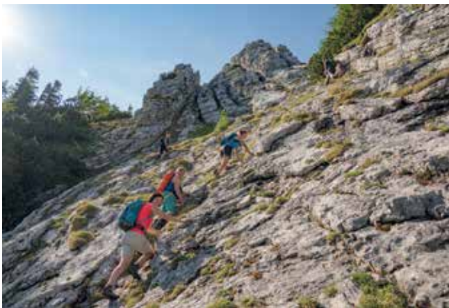
Kurz vorm Spielberggipfel

Leitung: Ernst Ornetsmüller, 0664/8374886, e.ornetsmueller@asak.at