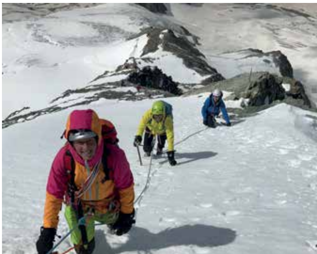
Aufstieg zum Aletschhorn (Schweiz)