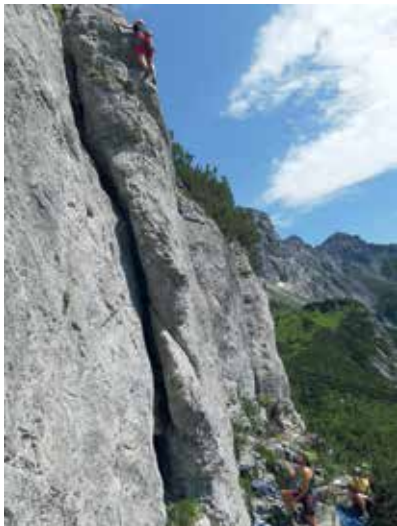
Kletterer auf Felsschuppe

Leitung: Wolfgang Hemetsberger, 0650/8246591, klettern.nf.lenzing@gmail.com