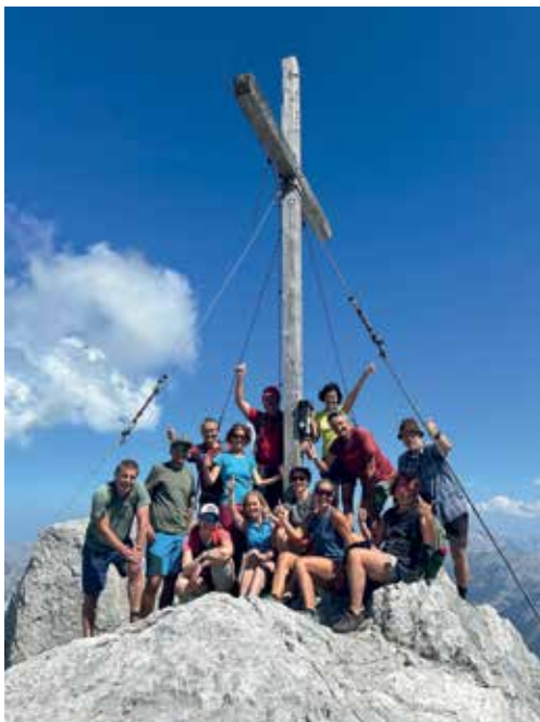
Gipfel des Birnhorn