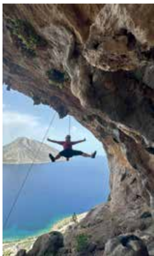
Klettern auf Kalymnos