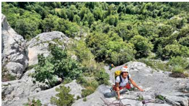
Klettern im Grazer Bergland