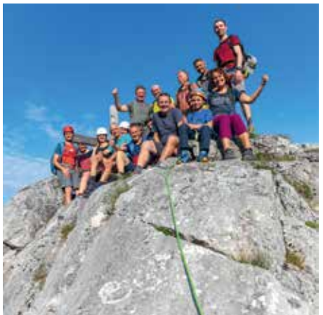
Am Gipfel der Adlerspitze