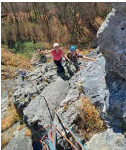
Am herbstlichen Hengstpass (1. SL)