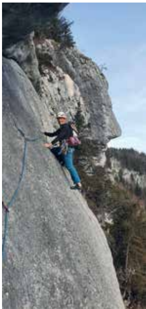
Klettern an der Ewigen Wand

Anmeldung: per WhatsApp oder telefonisch