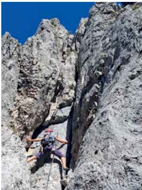
Im SW-Kamin am Adlerspitz