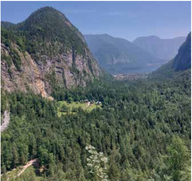
Blick in das Echerntal